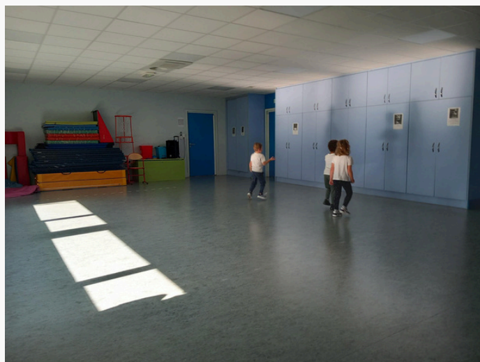
Salle de motricité