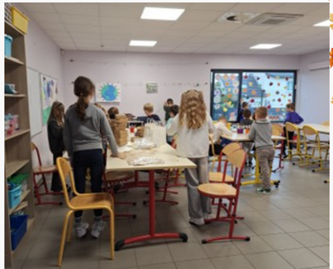
Salle d'activités du CP au CM2