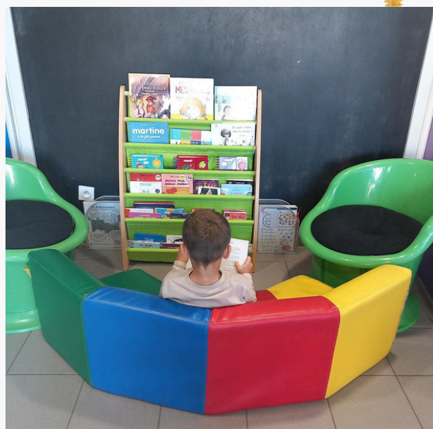
Coins calmes dans l'entrée