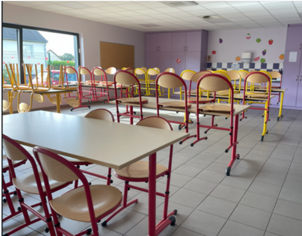
Salle de repas du CP au CM2