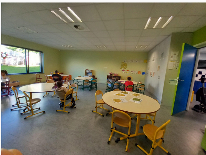
Salle des maternelles